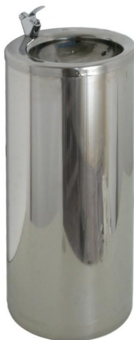
Zdroj pitnej vody č. kat. 1700 nerezový valec