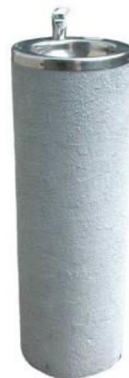
Zdroj pitnej vody č. kat. 1710 valec plastový