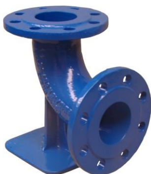
Na obr. 9202