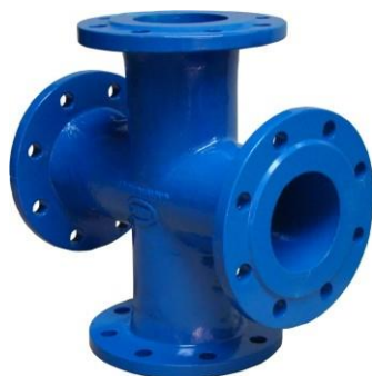
Na obr. 9218