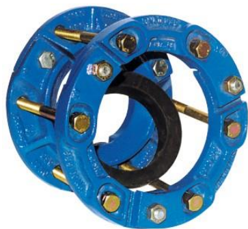
Na obr. 9101