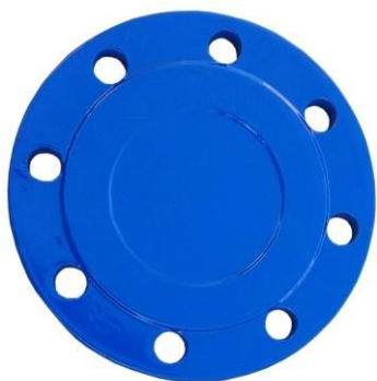
Na obr. 9219