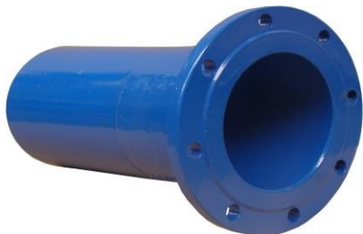
Na obr. 9201