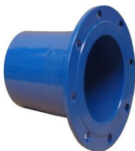
Na obr. 9221