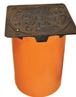
Na obr.teleskopický poklop s rúrou d315